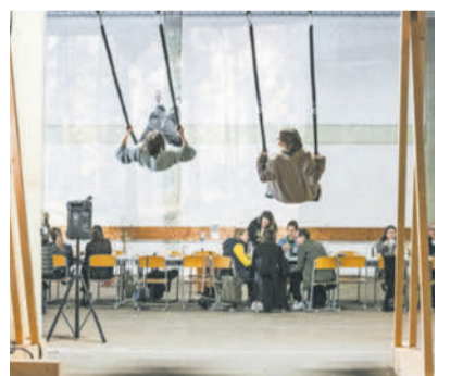
„eat & swing“ findet jeden Mittwoch um 12 Uhr statt. CAMPUSVÄRE