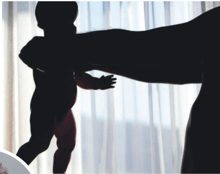
Auch in Vorarlberg ist häusliche Gewalt gegen Kinder regelmäßig Thema - hier illustriert und nachgestellt mittels Puppe.

Aus der Studie geht außerdem hervor, dass sich diese Werte zuletzt kaum verändert haben. 2014 waren noch 12 Prozent der Elternteile vollkommen davon überzeugt, dass ein gelegentlicher kleiner Klaps keinem Kind schade, 2023 waren es